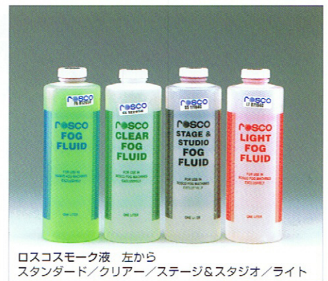
ロスコスモーク液 左から スタンダード/クリアー/ステージ&スタジオ/ライト

ロスコスモークマシンから大気中に放出される煙は煙感知器に反応します。不特定多数の人が出入りする建物内で使用する場合は、必ず事前に建物内の防災センターに連絡するようにしてください。